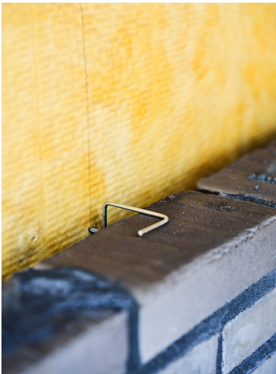
Murkramla nr. 3 i kombination med pendel nr. 12.